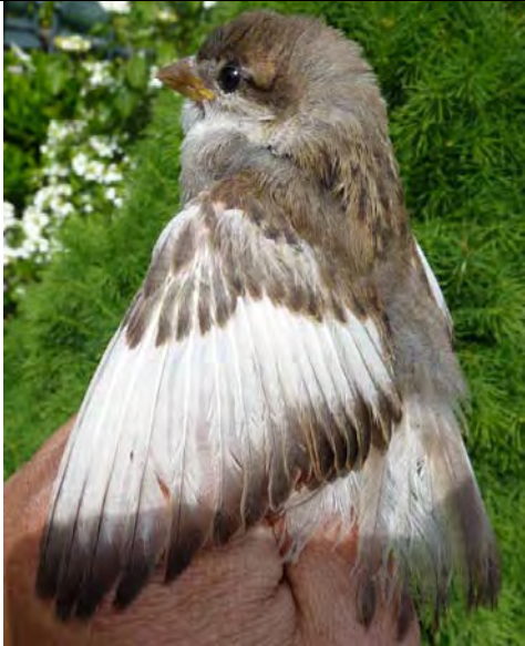
Pas uitgevlogen juveniele huismus met witte veren door slechte conditie. beoordeling conditie Huismus Hein van Grouw.